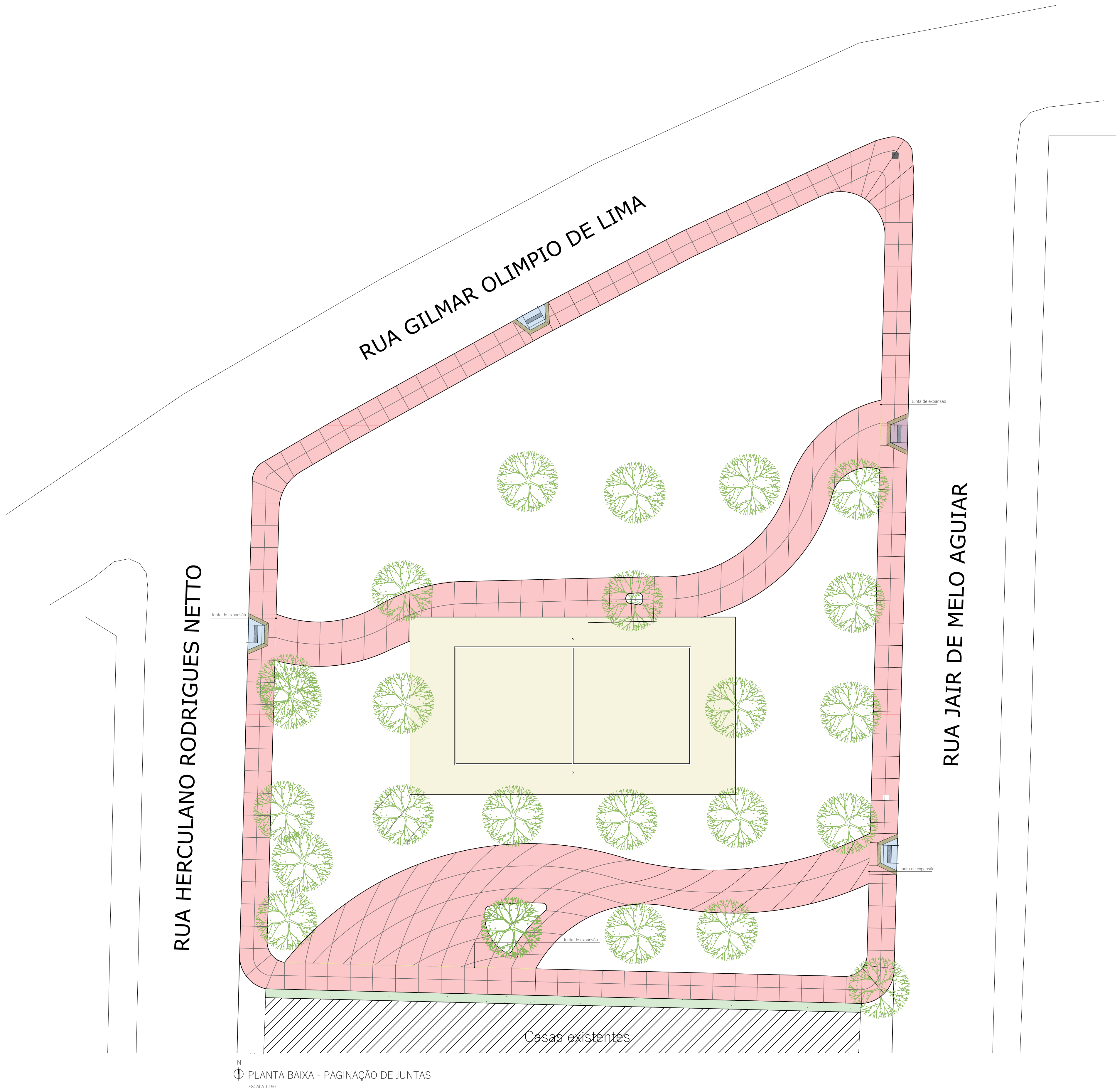
PLANTA BAIXA - PAGINAÇÃO DE JUNTAS ESCALA 1:100